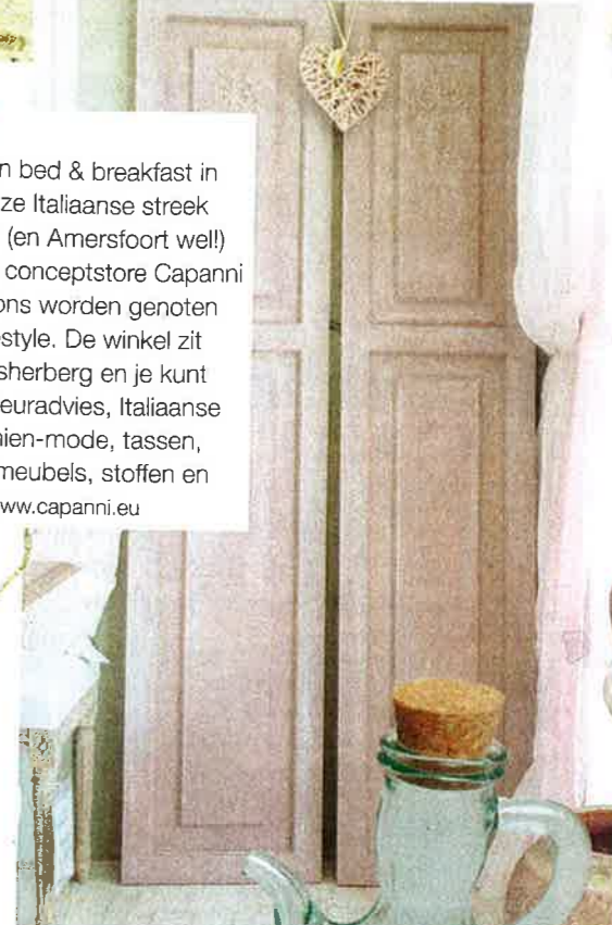
Olie- of azijnkannetje van groen gerecycled glas € 5,95 (Dille & Kamille).

Casa Capanni is een bed & breakfast in Toscane. Omdat deze Italiaanse streek niet om de hoek ligt (en Amersfoort well!) kan er bij de nieuwe conceptstore Capanni Lifestyle nu ook bij ons worden genoten van de Italiaanse lifestyle. De winkel zit in de vroegere Stadsherberg en je kunt er terecht voor interieuradvies, Italiaanse koffie, mooie bohémien-mode, tassen, sieraden, landelijke meubels, stoffen en woonaccessoires. www.capanni.eu